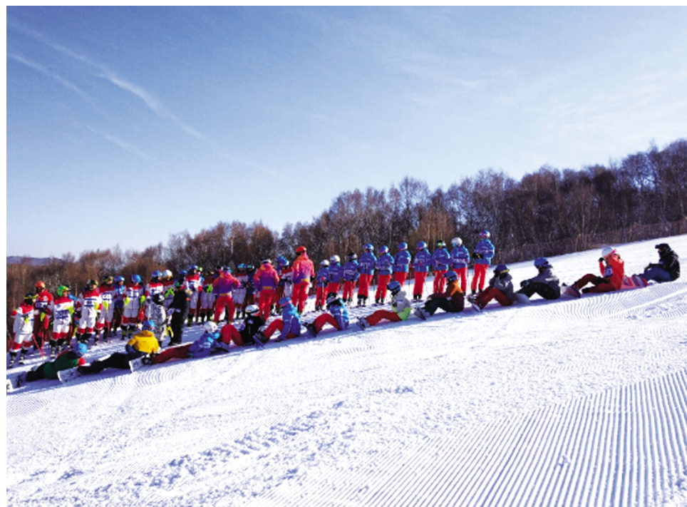
■《河北省大众滑雪等级标准(试行)》首次测评。